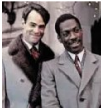
Il film Eddie Murphy e Dan Aykroyd in Una poltrona per due